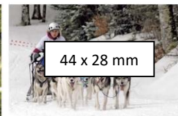
44 x 28 mm