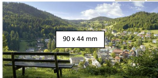
90 x 44 mm