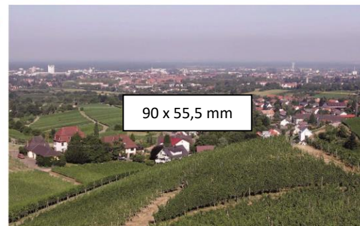
90 x 55,5 mm