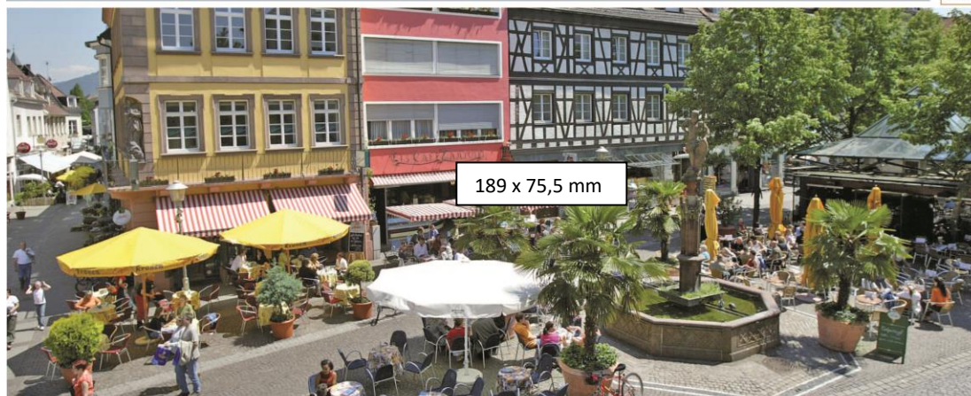
189 x 75,5 mm

Höhenlage: Min. 142, Max. 690, Kernort 142