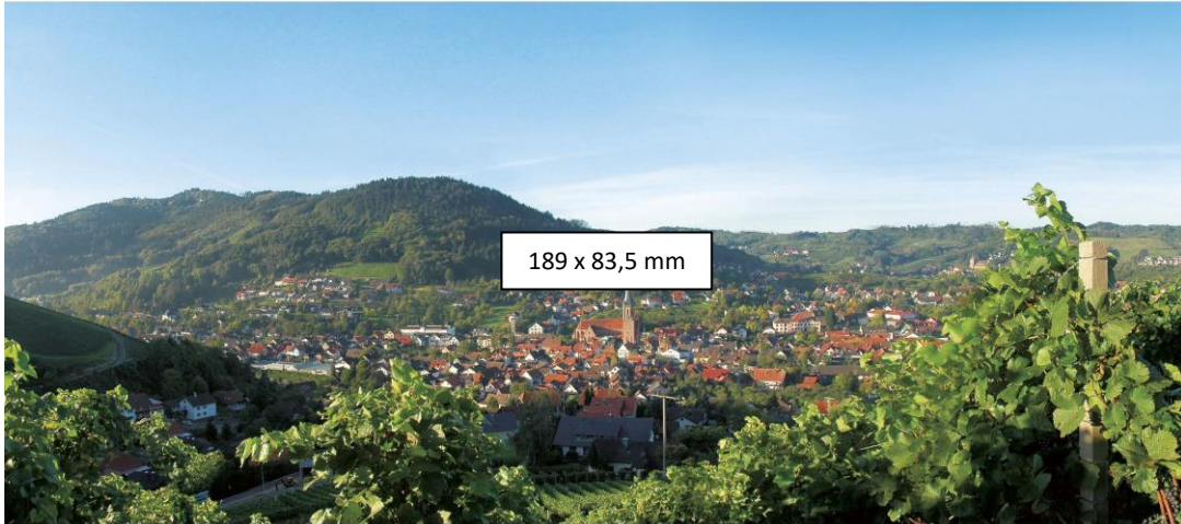
189 x 83,5 mm