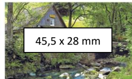
45,5 x 28 mm