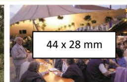
44 x 28 mm