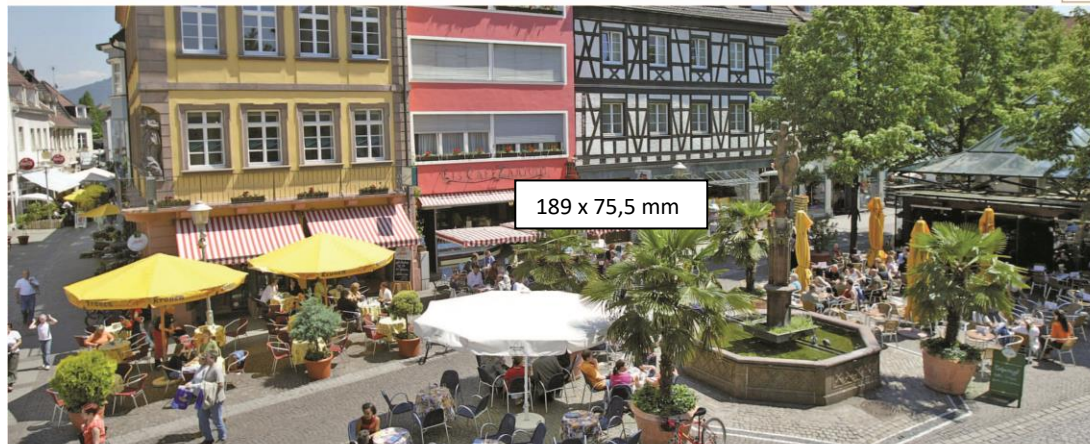
189 x 75,5 mm

Höhenlage: Min. 142, Max. 690, Kernort 142