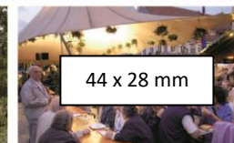
44 x 28 mm