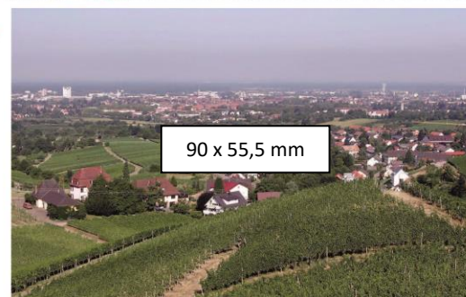
90 x 55,5 mm